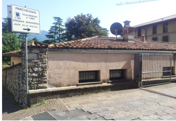
15 VIA XX SETTEMBRE - pulizia + antiscritta