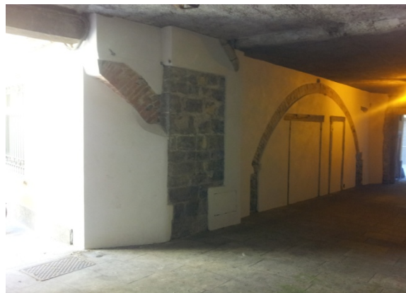
2 PORTICETTO PORTO 1 - Sabbiatura a bassa pressione di laterizi presenti, fondo inibente intonachino e antiscrittura