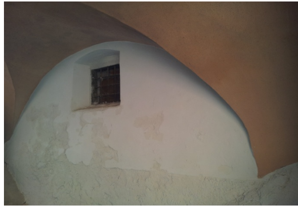
22 VICOLO SAN GIOVANNI AL RIO 2 - inibente più tinteggiatura di porzione