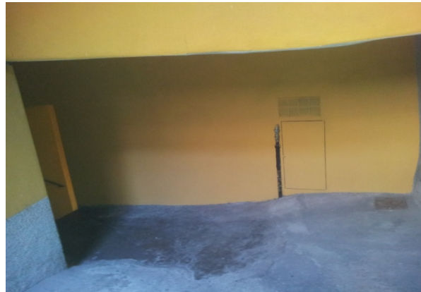
7 PORTICHETTO SAN GIORGIO – Fondo Inibente. + Pittura Quarzo