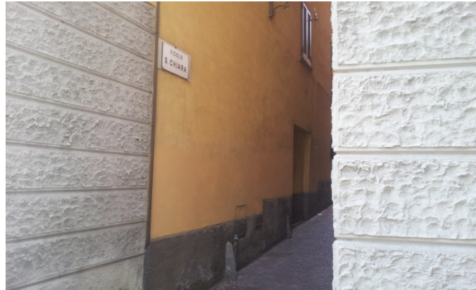
25 VICOLO SANTA CHIARA posa inibente più tinteggiatura a sfumare