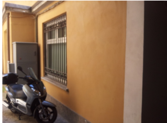
6 PORTICHETTO PORTO 5 – Fondo inibente + tinteggiatura + antiscritta