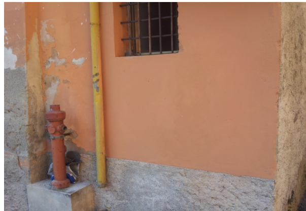
23 VICOLO SAN GIOVANNI AL RIO 3 - inibente Pittura Quarzo