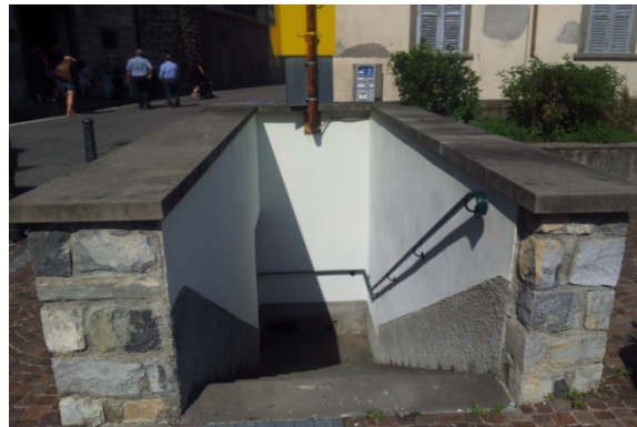
1 BORGIO SANTA MARIA - Inibente, Rete, Rasatura, Intonaco, antiscrittura