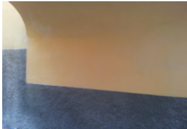
17 VICOLO FOSSA - posa inibente, intonachino + antiscritta