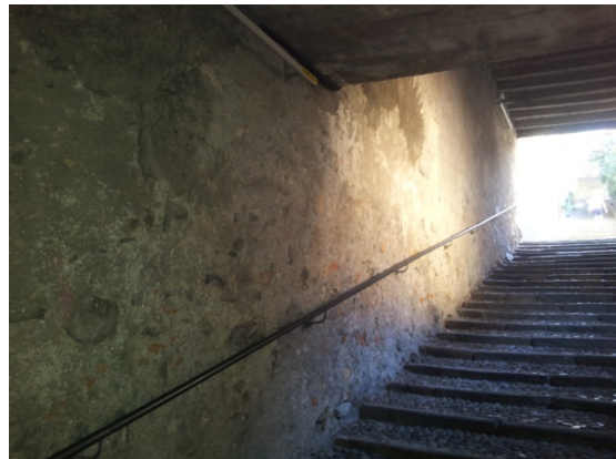
20 VICOLO RATTO - microaeroabrasione