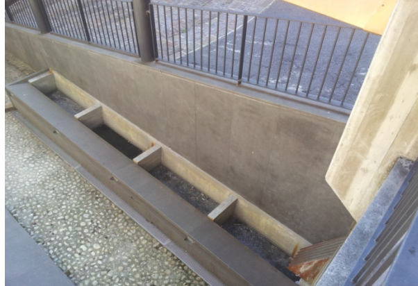
24 LAVATOIO VIC. SAN GIOVANNI AL RIO - microaeroabrasione a bassa pressione più anticrittina