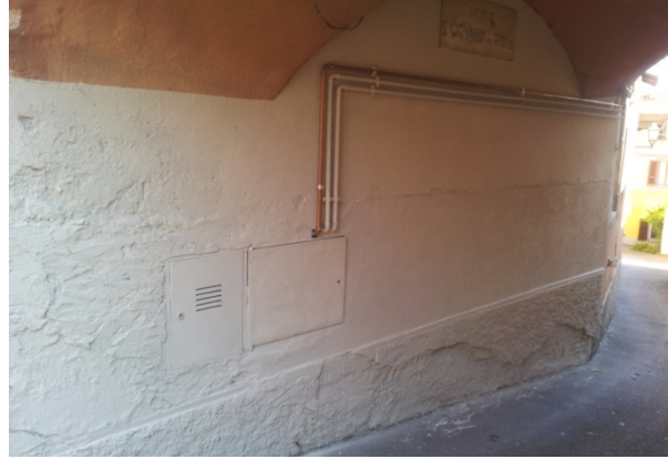
21 VICOLO SAN GIOVANNI AL RIO 1 – inibente più tinteggiatura a sfumare