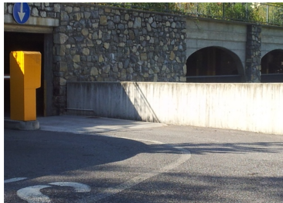
8 AUTORIMESSA TADINI microaeroabrasione su 4 punti