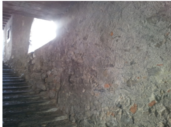
19 VICOLO RATTO - microaeroabrasione