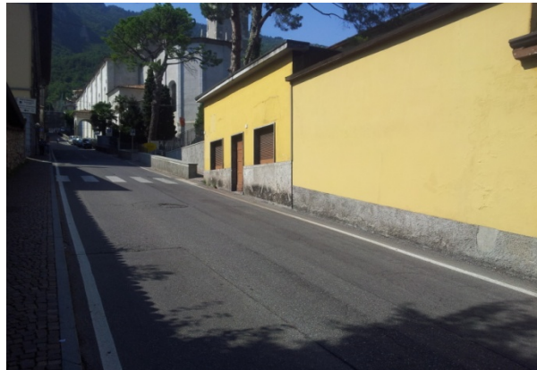
16 VIA XX SETTEMBRE inibente pie tinteggiatura a sfumare