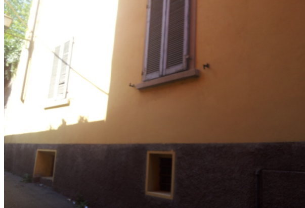
18 VICOLO FOSSA inibente microaeroabrasione piu tinteggiatura a sfumare