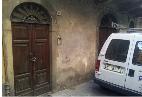
12 VIA GRAMSCI microaeroabrasione