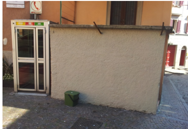
13 VIA MATTEOTTI - Inibitore più tinteggiatura